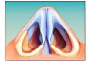
بعد از عمل