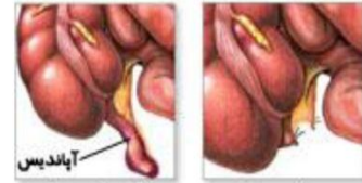
قبل از عمل