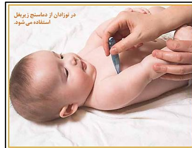
در نوزادان از دماسنج زیربغل استفاده می شود.